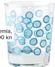
ČAŠA, Kremla, IKEA, 5,90 kn