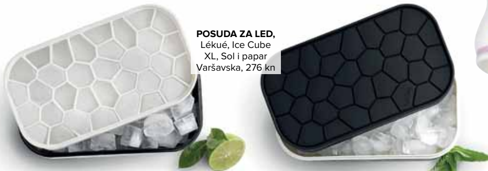
POSUDA ZA LED, Lékué, Ice Cube XL, Sol i papar Varšavska, 276 kn