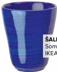
ŠALICA, Sommar 2016., IKEA, 14,90 kn