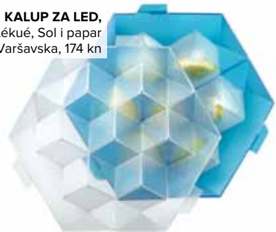
KALUP ZA LED, Lékué, Sol i papar Varšavska, 174 kn